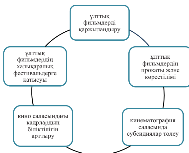
2-сурет – Ұлттық киноны қолдау мемлекеттік орталығының (бірыңғай оператордың) негізгі қызметі Ескерту – [24] дереккөздің негізінде автормен құрастырылды

Қазақстанда 2019 жылдан бастап ұлттық фильмдерді мемлекеттік қаржыландырудағы бірыңғай оператор ретінде Ұлттық киноны қолдау мемлекеттік орталығы (бұдан әрі – Орталық) құрылып, киножобаларды қаржыландыру, қолдау жұмыстарын іске асырады [24]. Бұл Орталықтың негізгі қызметінің бағыттары 2-суретте көрсетілген.