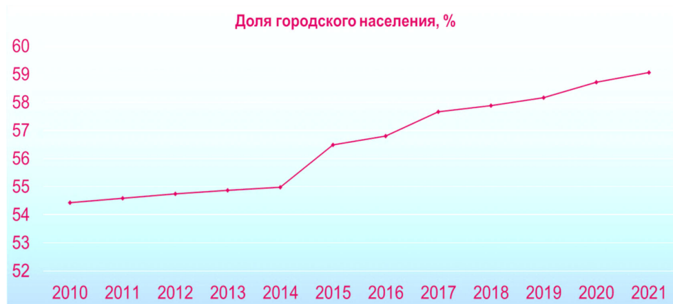
Рисунок 3 – Доля городского населения в Казахстане за 2010-2021 годы

Интенсивно внедряемый со второй половины прошлого века научно-технический прогресс обусловил изменение структуры жизнедеятельности общества и соответственно расселения населения и территориальной форм системы поселений в мире. А в Казахстане как и в других странах бывшего Союза, такие изменения прослеживались и с переходом на новую экономическую формацию. В этот период основной тенденцией расселения было развитие урбанизации: расширенное воспроизводство городского расселения и городского образа жизни, труда, поведения культуры, быта. Так, по данным переписи населения 1989 года в городах Казахстана проживало 57,1 % от всей численности, а доля этнических казахов – 27,1 % при 40 % казахского населения республики в целом; в 1999 же году доля казахов в городском населении выросла и достигла уже 43,1 %. А в 2021 году городское население достигло 59,1 %, и в дальнейшем по прогнозу этот показатель имеет тенденцию к росту (Рисунок 3).