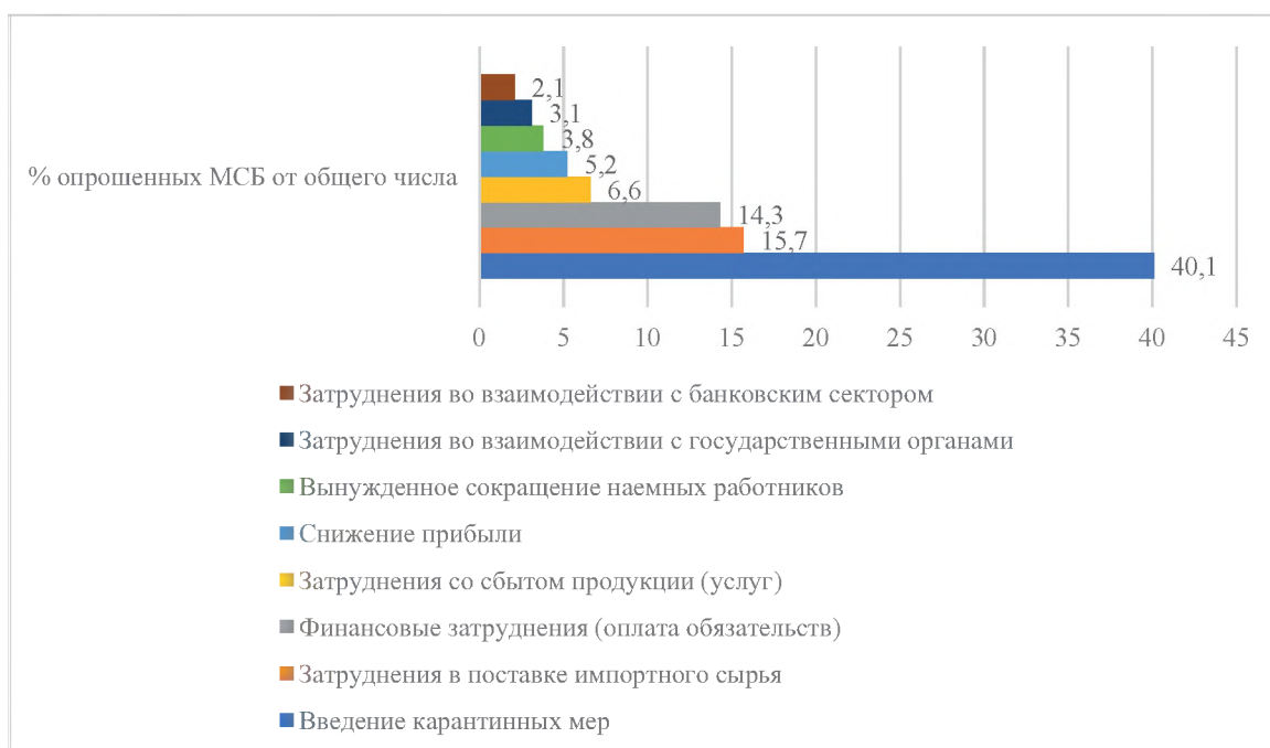
Рисунок 1 – Наиболее затруднительные ситуации по ведению бизнеса во время COVID-19 по результатам опроса

Пандемия помимо рисков, связанных со здоровьем, принесла и другие трудности ведения бизнеса (Рисунок 1).