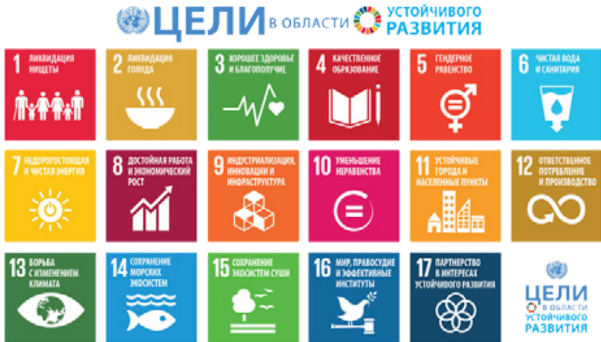
Рисунок 2 – Цели устойчивого развития [11]

Цель 14.7 – К 2030 году повысить экономическую выгоду для Малых развивающихся островов-государств и наименее развитым странам от устойчивого использования морских ресурсов, путем устойчивого управления рыболовством, аква культурой и туризмом [10].