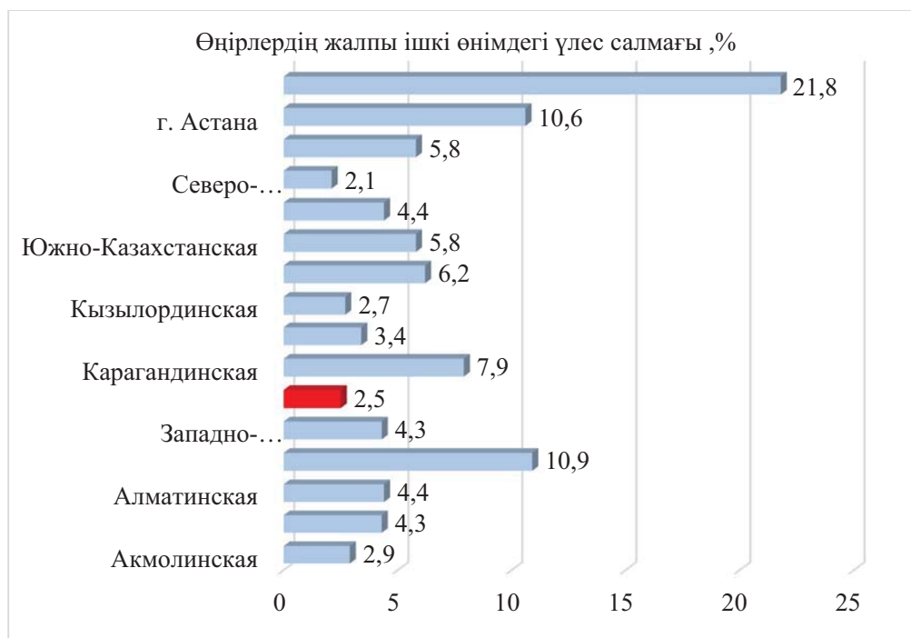
Сурет 2 – Өңірлердің жалпы ішкі өнімдегі үлес салмағы, % Ескерту – [2] дереккөзі негізінде авторлармен құрастырылған

Облыс экономикасының дамуында туризмнің де үлесі жоғары емес. Келген туристтерге қызмет көрсету саны бойынша қалыптасқан оң динамикаға қарамастан, Қазақстанның облыстары арасында Жамбыл облысының үлесі 2019 жылы бар болғаны 0,03 % құрады (кесте 1).