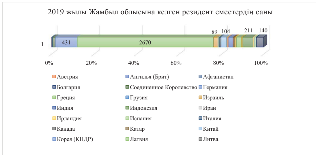
Сурет 4 – 2019 жылы Жамбыл облысына келген резидент еместердің саны Ескерту – [2] дереккөзі негізінде авторлармен құрастырылған

Өз кезегінде, 2019 жылы алыс шетел елдерінен облысқа келесі елдердің азаматтары келген (сурет 4).