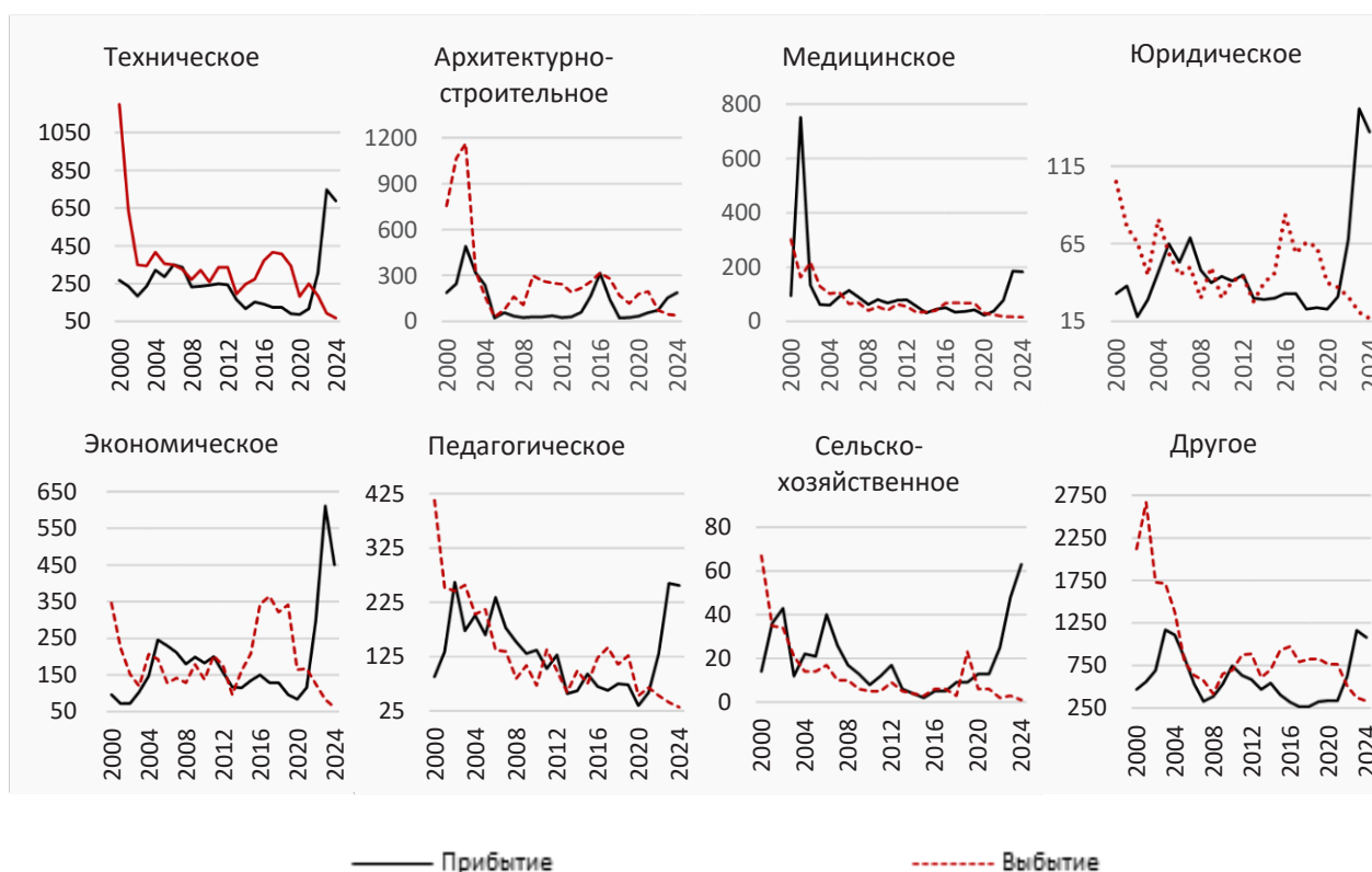
Рисунок 3 – Динамика внешней миграции специалистов по направлениям образования, Алматы, человек Примечание: составлено авторами на основе анализа [3]

Приток специалистов на рынок труда Алматы в 2022–2024 гг. возрос по следующим направлениям: экономика, строительство, сельское хозяйство, медицина, юриспруденция, технические и педагогические специальности. Структура прибывших специалистов демонстрирует доминирование технических кадров — 21,8 %, далее следуют специалисты в области экономики (17,1 %) и педагогики (8,1 %). Юристы, медики и специалисты строительного профиля представлены равными долями — по 5 % каждый. Наименьшая доля приходится на сельскохозяйственных специалистов (1,7 %), в то время как прочие направления составляют 36 %.