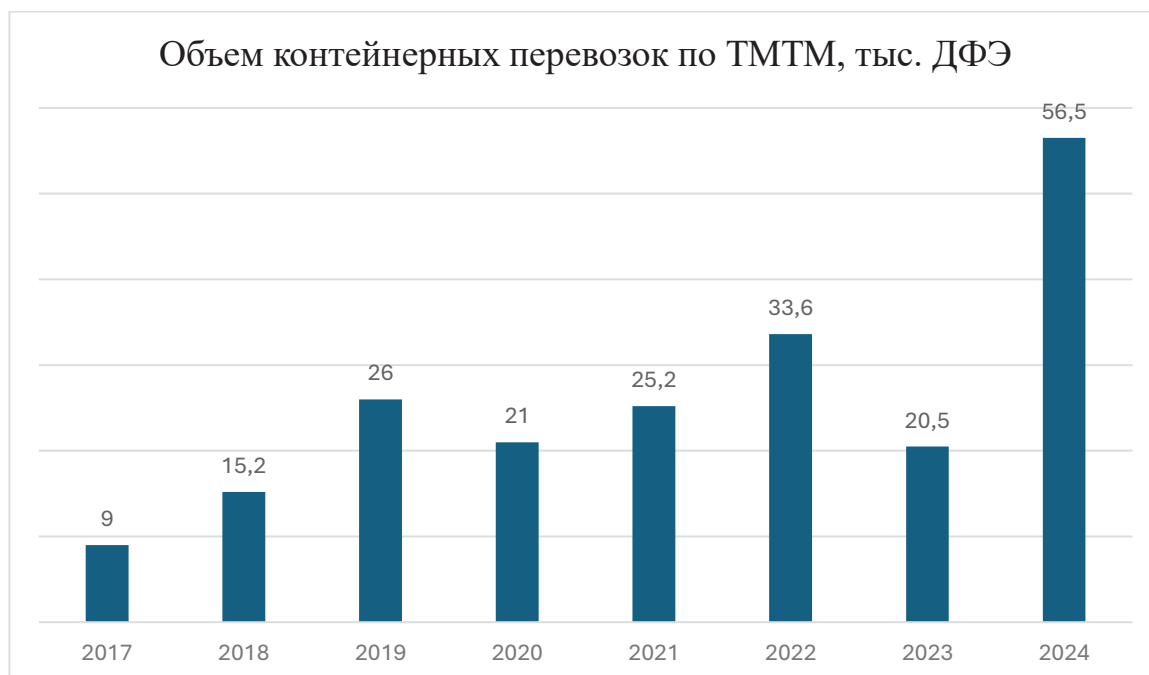
Рисунок 3. Объем контейнерных перевозок по ТМТМ, тыс. ДФЭ

Но уже с января 2024 года ситуация начала улучшаться, было отремонтировано более 1500 км железнодорожного полотна и работы все еще бесперебойно ведутся, от чего объем перевозок увеличился в 2,5 раза, при этом транзит китайских контейнеров вырос в три раза, что свидетельствует о возрастании спроса на этот коридор. Казахстан занимает ключевое место в логистической сети ТМТМ, на его территории сосредоточена более 80% сухопутного транзита, а порты на побережье Каспийского моря,